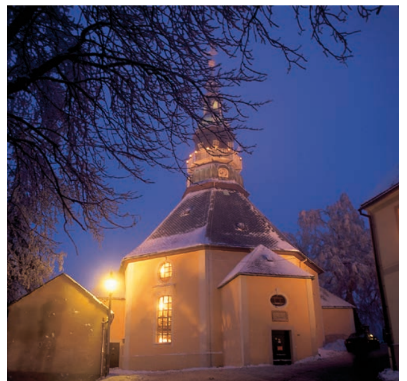
Oblíbené trhy v Seiffenu začínají 29. listopadu, v kostele budou koncerty.