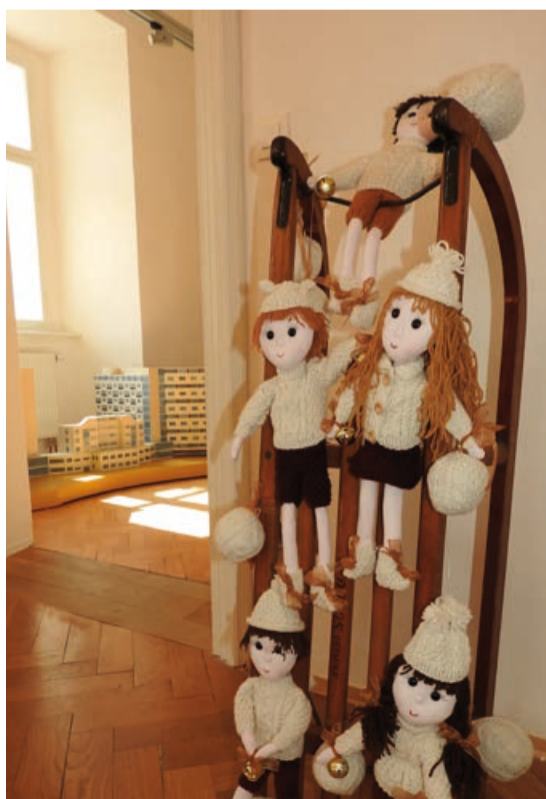
26. listopadu se v zámku Valdštejnů otevře další Přehlídka nápadů, zručnosti, řemesel a vtipu.

Německý Deutscheidorf pořádá vánoční trh v sobotu 30. listopadu od 14 hodin na návsi. Hrát bude dechovka, ochutnáte regionální dobroty a v 16 hodin děti potěší vánoční muž. Vánoce v Seiffenu začínají v pátek 29. listopadu a trhy potrvají do 22. prosince. Velký hornický průvod se bude konat 14. prosince od 15.30 hodin, ten menší pak v sobotu 30. prosince. Trh na nádvoří Rittergut v Olbernhau se bude konat od 30. listopadu do 15. prosince, a to každý den od 12 hodin. V Marienbergu bude trh otevřen dokonce už od večera 27. listopadu. I zde bude vrcholem programu velký hornický průvod v neděli 15. prosince.