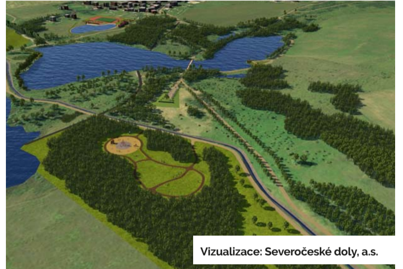
Vizualizace: Severočeské doly, a.s.

„Chceme vytvořit atraktivní prostor mezi uhelným lomem Bílina a obydleným územím Mariánských Radčic a Lomu jako přirozenou součást krajiny formované po ukončení těžby,“ dodává. Zvelebení prostoru, který byl dlouhá léta ponechán přirozenému vývoji, bude zahrnovat i úpravy zeleně. Měly by ale zachovat současný ráz přírody. Díky minimálním zásahům člověka se tu totiž vytvořily zcela nové biotopy, především v mokřadech a okolo vodních ploch, které obýva-