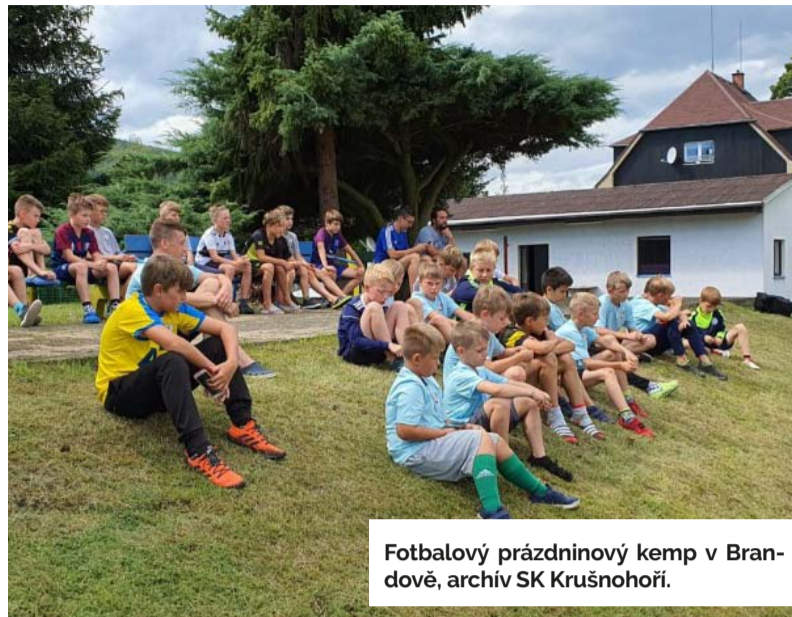
Fotbalový prázdninový kemp v Brandově, archiv SK Krušnohoří.

Batab aneb Badatelský tábor pro děti od 7 do 15 let pořádá Centrum ekologické výchovy