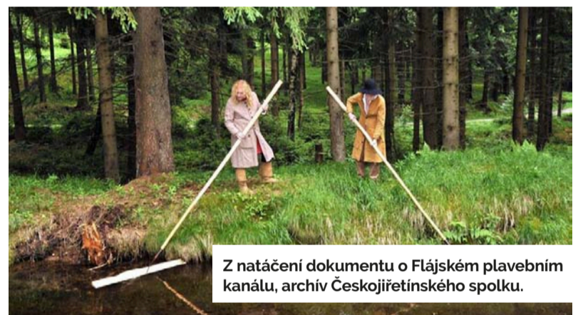
Z natáčení dokumentu o Flájském plavebním kanálu.

Českojiřetínský spolek se významně zasazuje o rekonstrukci nádraží v Moldavě v Krušných horách a obnovu propojení horské dráhy z Mostu do Freibergu. Bohužel akce, naplánované pro letošní rok, je spolek